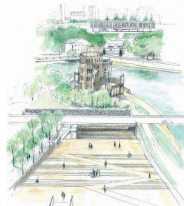
(参考) 高橋志保彦氏の アンダーパスの提案 (アイデアコンペで特別賞)