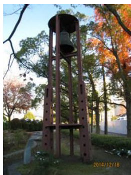
二丁目「平和の鐘」 （2014年12月撮影）