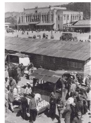
1946年正月頃のヤミ市

1946年10月のヤミ値は白米一升70円、牛肉100匁40円、ビール一本50円…、いずれも公定価格の数倍で飛ぶように売れた。闇市の購買力は戦後4ヶ月で当時の広島市の予算の倍以上の3,000万円にも達したと云われている。