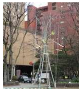
竹と遊ぶ (石丸勝三作)