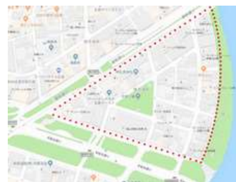
東平塚地区エリア

これはこれで写真にはなるのですが、街角の空気は変わったものになると思われます。そろそろ「東平塚 美の再発見 そのII」をやってみたいと思います。