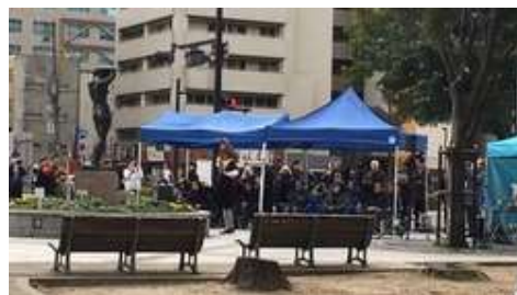
銅像の前でオープンセレモニー

今回は実験的な試みであり、出展数も少ないので、盛り上がりには欠ける点はやむを得ない。作品を年々増やして展示エリアを拡大していき、将来的には国際コンペで多くの作品を募って、審査経過が分かるような芸術祭にまで発展させ、平和大通りの一大イベントになればよい。