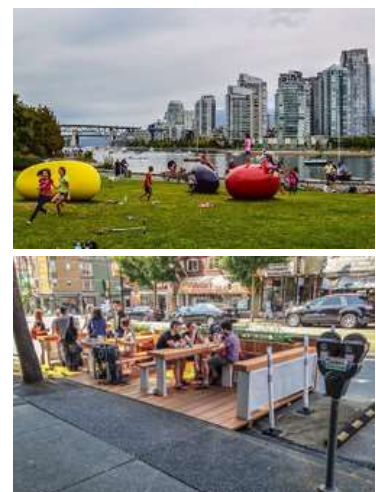
カナダ・バンクーバーの事例

昨今、「プレイス・ベスト・プランニング」(小さな場所から始めるまちづくり—自然に人が集まり、交流が進むような魅力的な空間を作る)という計画手法が注目され、マクロな分析視点と並行して、ミクロなコミュニティの視点から計画を組み立て、都市を改善しようという動きが出てきています。都市成熟の時代において、まちづくりのあり方や視点を大きく見直すべき時期に来ていると考えられます。併せて、市民や企業の動きも以前とは