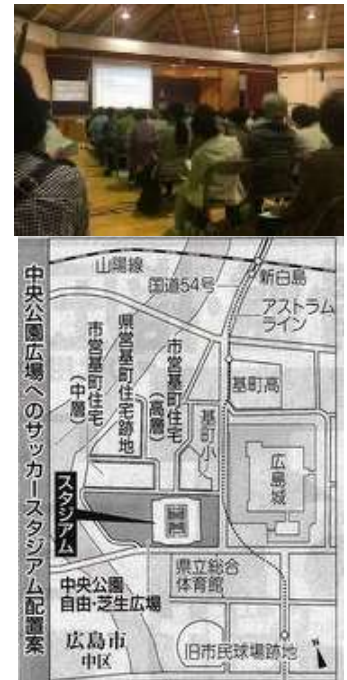
中国新聞(2018. 6. 23)

それに対して住民側からは「基町地区が繁華街になることを望んでいない」など反対意見が多く出たが、地元住民との協議会を設置して議論を続ける必要性については一致し、今月にも設置予定。