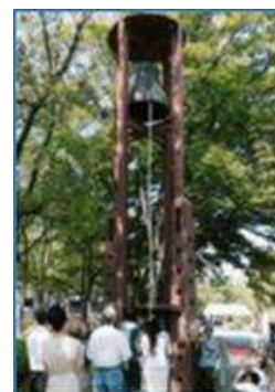
順番に鐘を打ち鳴らす 祈念式参加のみなさん