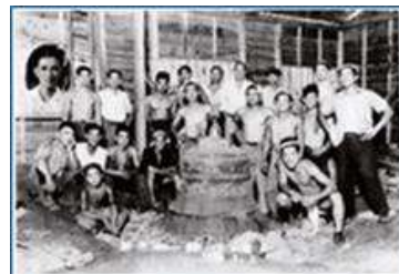
緑井村の鋳物工場にて、 やっと完成し喜びに沸く

参加者全員が鐘を撞き、原爆死没者の慰霊と核兵器も戦争もない世界の実現を願います。