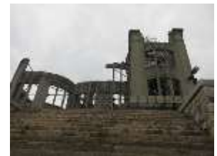
雁木から見る原爆ドーム