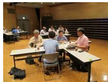
平和都市法制定 70 周年を記念して将来の街づくりを話し合うワールドカフェ

か、問われている。次は被爆 80 周年、さらに 100 周年が待ち構えている。立法時の寺光の思いはあまりに現実離れしていたが、復興を果たした今、都市づくりに新たな理念の確立が要請されている今、寺光の思いは拠り所として浮上するであろう。当然、現下の世界情勢も考慮に入れなければならない。広島が平和都市法で生かされてきたことに感謝するならば、改めて多くの、重要な目標と、アクションを展開すべき時期は今を置いてないことに気付くべきである。オリンピックや万博のような一過性のイベントを超えて、地に定着させ、真に世界市民から支持される道は必ず存在するはずであり、その道を模索することが寺光に対する真心からの恩返しといえるであろう。