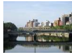
橋を渡る市内電車

このように、先人が営々と築き上げ護ってきたこれらの市民遺産を、次の世代へと引き継いでいく義務と責任が、私達世代にあるのではないのでしょうか。