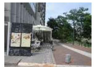
京橋川沿いのオープンカフェ